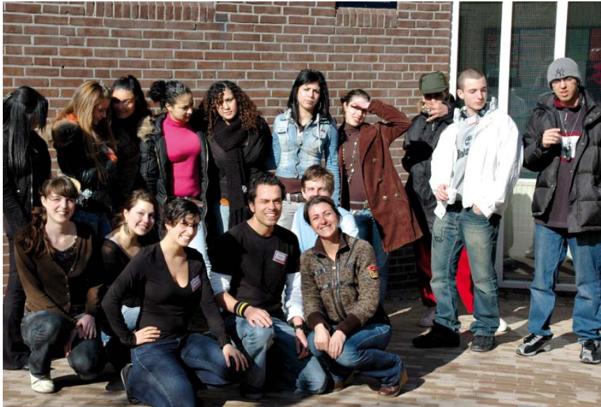
Jongeren uit Zeeburg presenteren het ontwerp jongerencentrum Karrewiel

Een Chillroom, gebedsruimte of fitnesszaal? Op 24 mei 2006 hebben jongeren hun ontwerp gepresenteerd over de inrichting en de programmering van een nieuw jongerencentrum in stadsdeel Zeeburg. 110 jongeren uit het stadsdeel werden betrokken bij dit bijzondere project. Het stadsdeelbestuur vindt het belangrijk dat het nieuwe jongerencentrum echt een plek voor en door jongeren wordt. De jongeren worden vanaf het begin naar hun mening en ideeën gevraagd. De jongeren zijn immers de toekomstige gebruikers van het centrum. De aankomende maanden wordt er bekeken op welke manier het ontwerp van de jongeren ingepast kan worden in het gebouw.