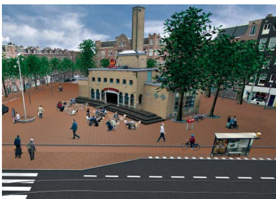
Het Javaplein is vernieuwd en heeft een vriendelijker karakter gekregen